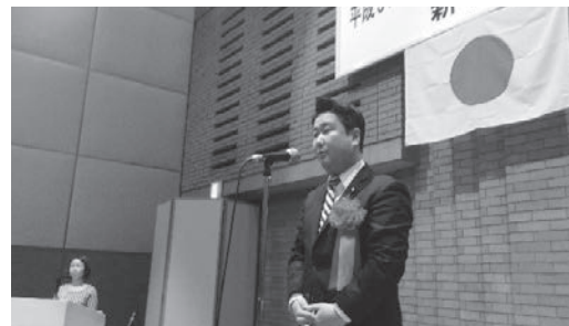
和田政宗 参議院議員挨拶