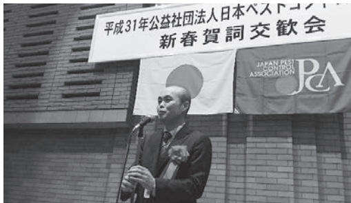
竹林経治 厚生労働省生活衛生課課長挨拶