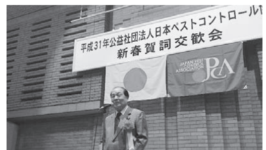
片山虎之助 参議院議員 挨拶