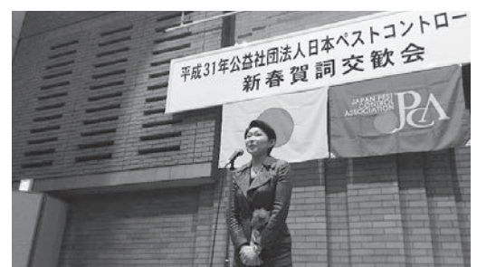
小淵優子 衆議院議員 挨拶