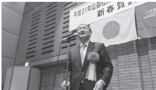
菅義偉 内閣官房長官挨拶